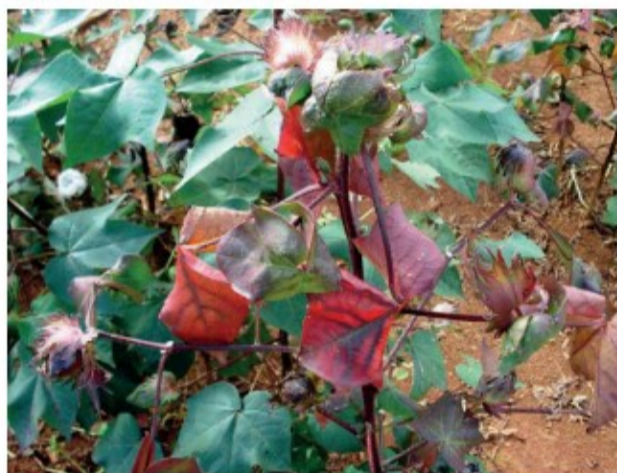
Algodoeiro com sintomas da doença azul

.Atualmente conhecido como "doença azul" o mosaico das nervuras forma Ribeirão Bonito foi assim chamado por se referir à ocorrência de uma suposta estirpe mais agressiva do vírus do mosaico das nervuras, observada por Costa e Carvalho (1962), afetando plantios de algodão no município de Ribeirão